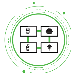
MYDIGITAL MENÙ BOARD

La gestione della vostra catena di locali a gestione diretta o in franchising è il naturale completamento del nostro sistema front end MyTec One.